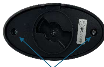
②裏側のビスを2本取る