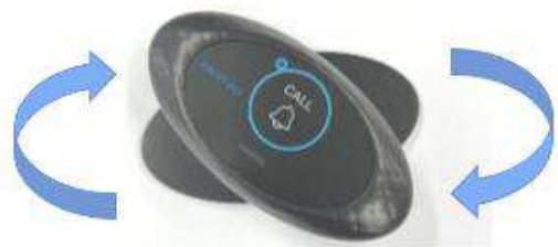
①土台の板をひねって外す